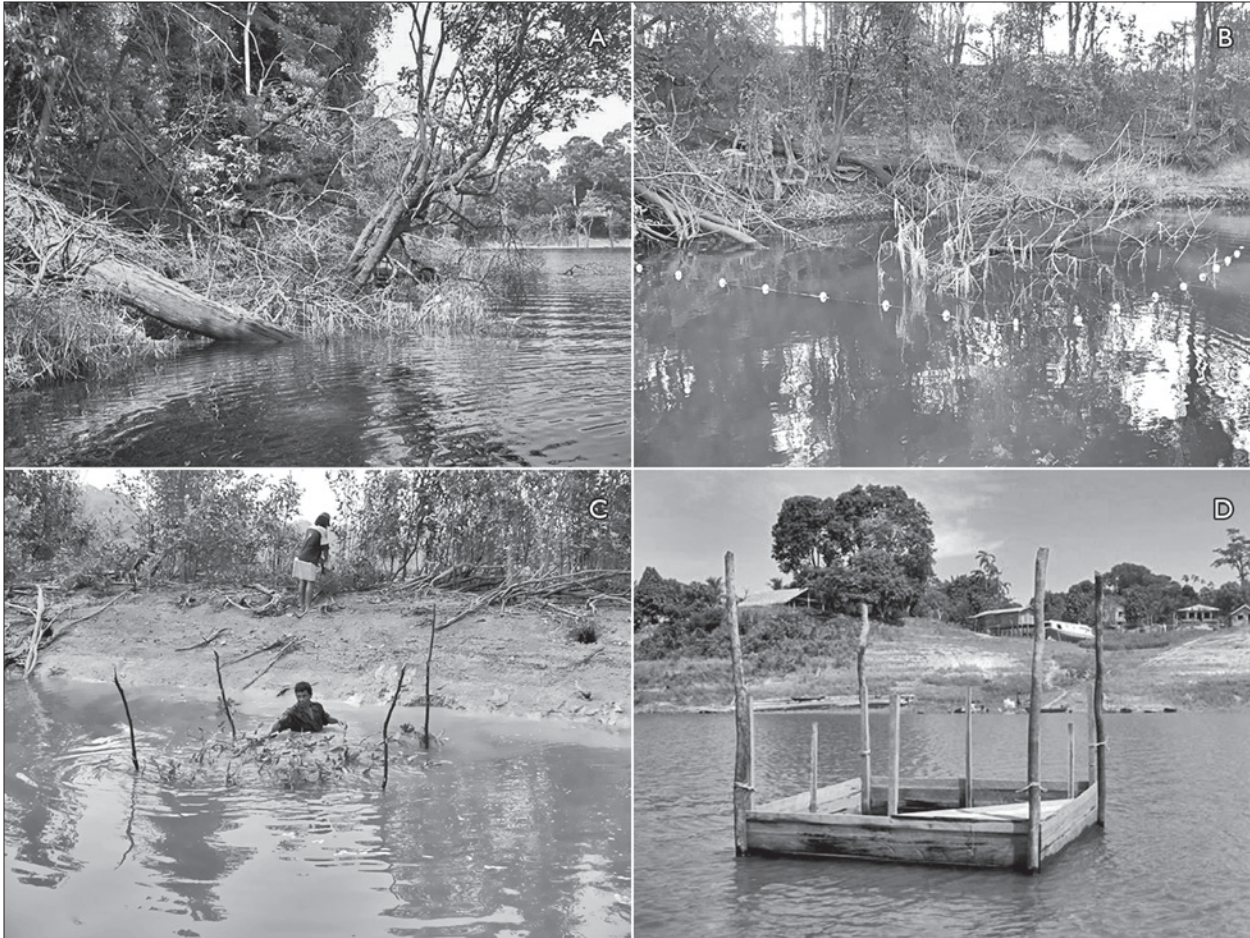
Figura 2. (A) Ambiente de troncos e ramos de vegetação ('pausada'), parcialmente submersos na margem do lago Ayapuá; (B) 'pausada' cercada com rede, para captura de acarás-discos; (C) atrator de pesca ('galhada') sendo montado com a utilização de ramos da vegetação marginal; (D) tanque ('curral') utilizado para o armazenamento dos acarás-discos capturados.

percebida pela transferência da vibração dos ramos ao cabo do remo que o pescador está segurando.